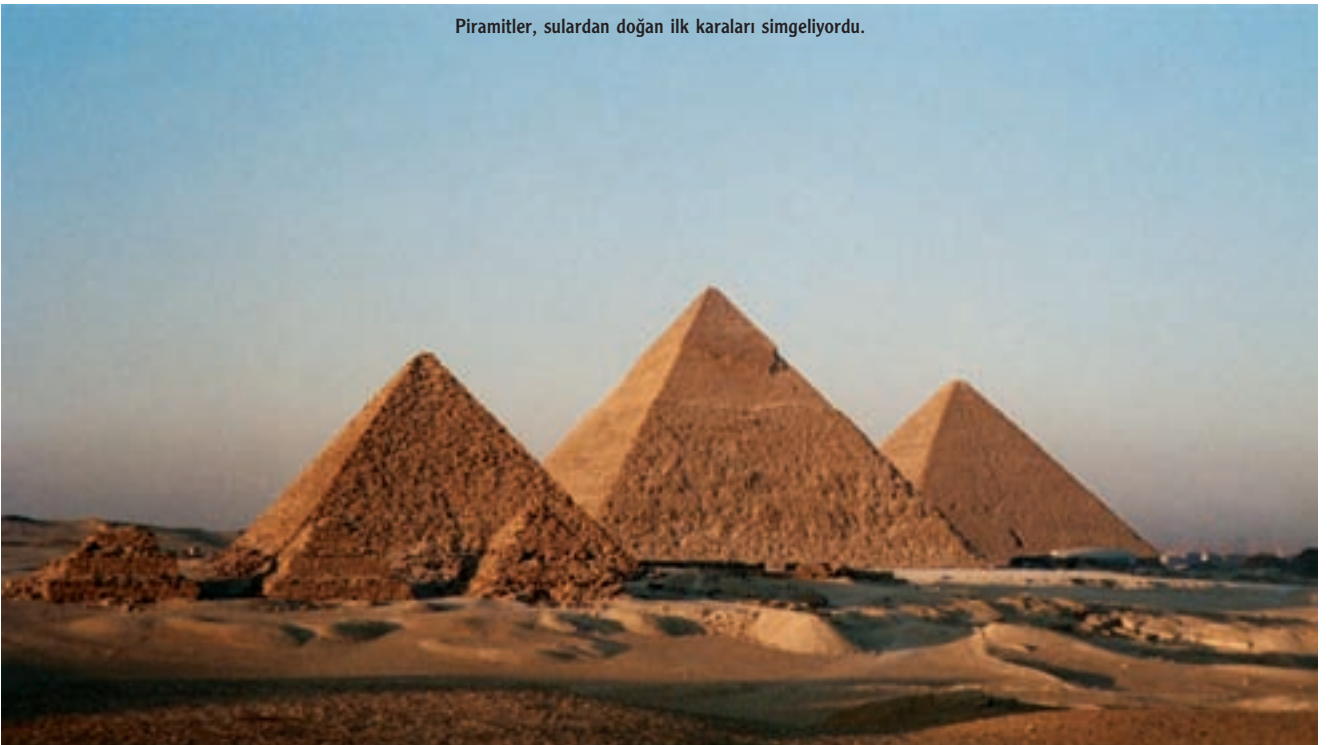
Piramitler, sulardan doğan ilk karaları simgeliyordu.

Kaynaklar: http://kron1.eng.ox.ac.uk/climate/pages/personal-thoughts/revisonist-mythology.php http://biopact.com/2006/11/did-civilization-arise-out-of.html http://dieoff.org/page127.htm http://scienceweek.com/2006/sw060217-4.htm