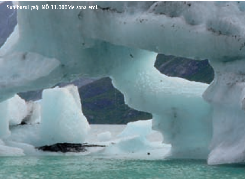
Son buzul çağı MÖ 11.000'de sona erdi.

İliman iklimle birlikte bitki ve hayvan yaşamının zenginleşmesi, insan için daha fazla besin anlamına geliyordu. Avcı toplayıcı bir kabile, buz çağına çetin koşullarında yalnızca belli sayıda grup üyesini besleyebiliyordu. Oysa yeni dönemin getirdiği yalnızca uygun iklim koşulları değil daha iyi beslenme koşullarıydı. Artık insanlar üşümeyecekleri gibi aç da kalmayacaklardı. Bu rahatlatıcı koşul beraberinde yeni gelişmeler getirdi. Daha uygun ko-