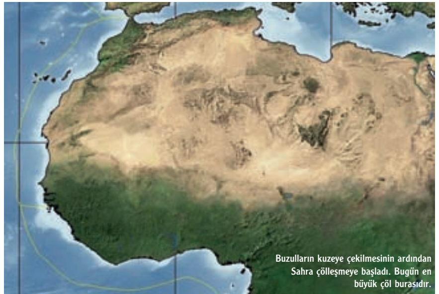
Buzulların kuzeye çekilmesinin ardından Sahra çölleşmeye başladı. Bugün en büyük çöl burasıdır.