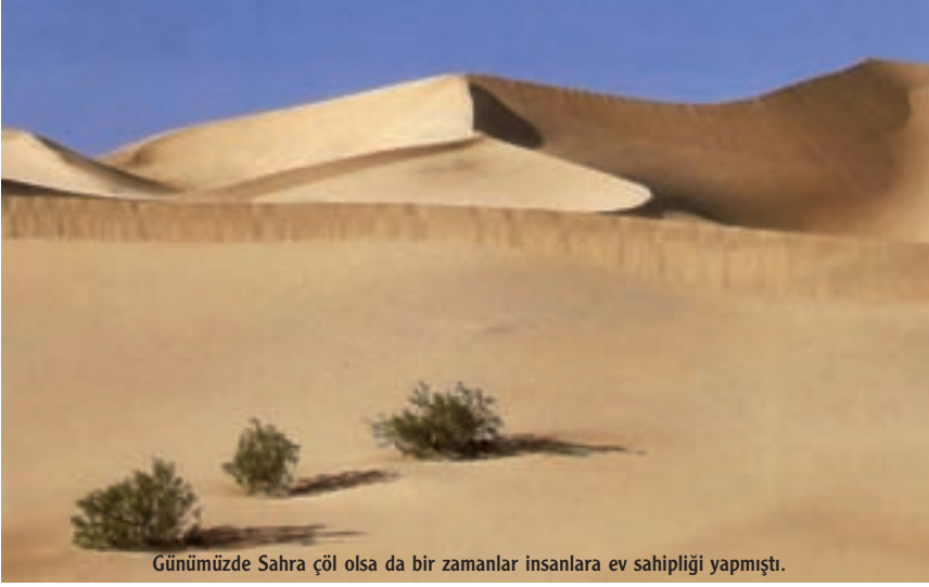
Günümüzde Sahra çöl olsa da bir zamanlar insanlara ev sahipliği yapmıştı.

şullarda daha iyi beslenen insanların ömrü uzamaya başlamış, aralarında altmış yaşına ulaşabilenler bile olmuştu. İnsan ömrünün uzaması, deneyimin biriktirilmesi ve genç nesle aktarılması açısından önemliydi. Henüz yazılı bir kültür oluşturamamış insanlar için kültürel birikim sözlü olarak aktarılıyordu. Uzun yıllar yaşamış, deneyimli görgülü yaşlılar, peşlerinden gelen genç kuşağı yetiştirip, onların av, savaş, deri yüzme, alet yapma, iz sürme gibi becerilerinin artmasına yardım ettiler. Yaşlılar aynı zamanda geleneklerin ve dini inanışların da yeni kuşağa aktarılmasından sorumluydu. Böylece inanç istemlerinin içine doğa güçlerinden ayrı olarak "atalar" kültü de girmeye başlamıştı. Saygı gören, bilgili atalar yarı kutsal bir konuma yerleştirilmiş, çoğu zaman ölümlerinden sonra bile onlara saygı duyulmaya devam ediliyordu.